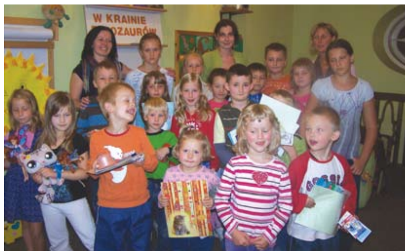
Najwytrwalsi uczestnicy letnich zajęć