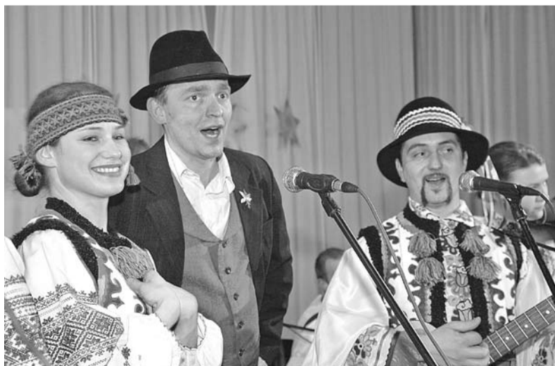
„Karnawał Karpacki”