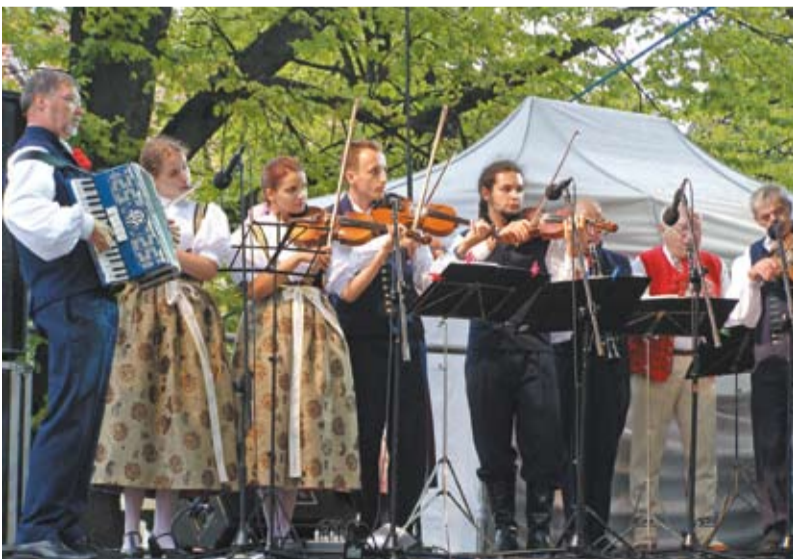
Cieszyński zespół na deskach sceny