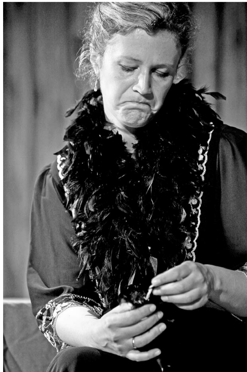
„Parady damsko-męskie” (jednoaktówka „Niedźwiedź”)