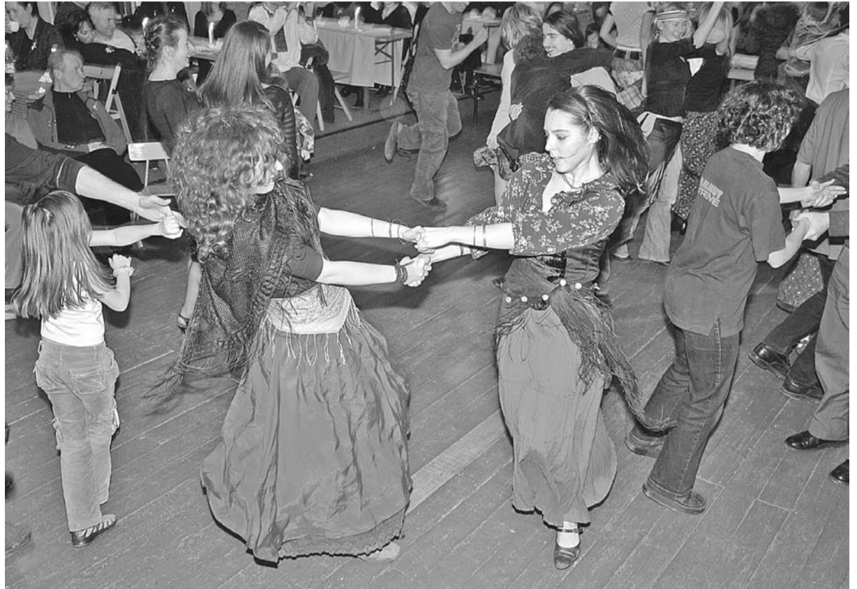
„Karnawał Karpacki”