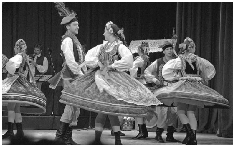
Tancerze występują na teatralnej scenie