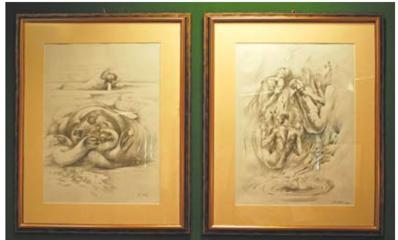
Prace Wojciecha Siudmaka