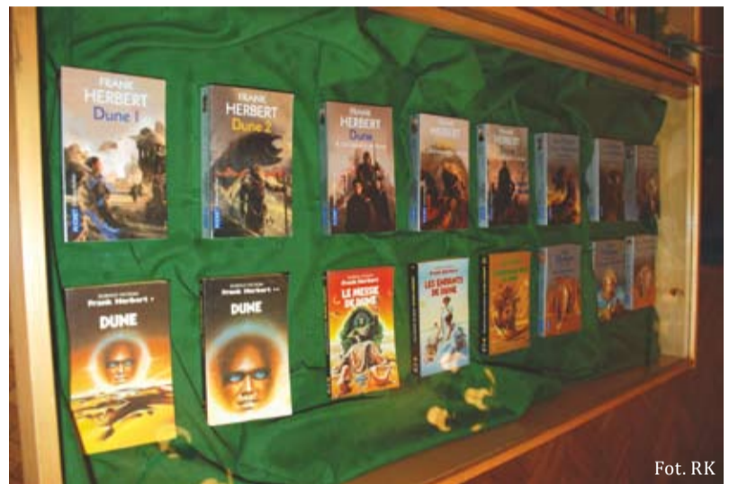
Kolekcja wydań „Diuny”