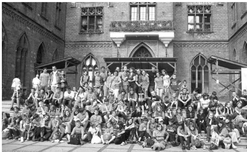
Harcerze na wakacjach, fot. z archiwum Hufca Ziemi Cieszyńskiej