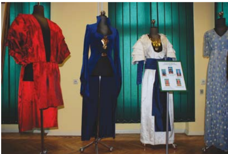
Kostiumy z planu filmowego „Diuny”