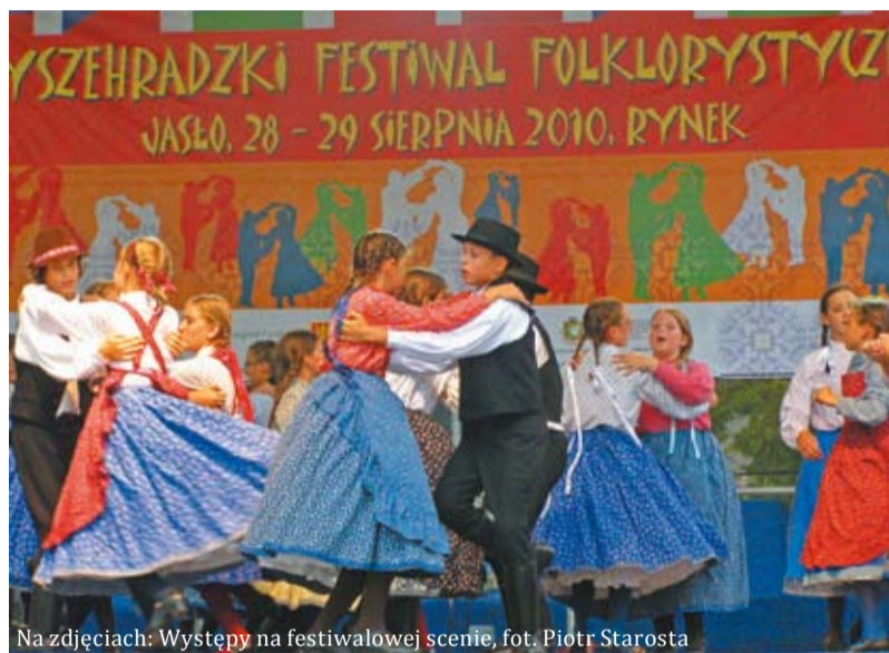
Na zdjęciach: Występy na festiwalowej scenie