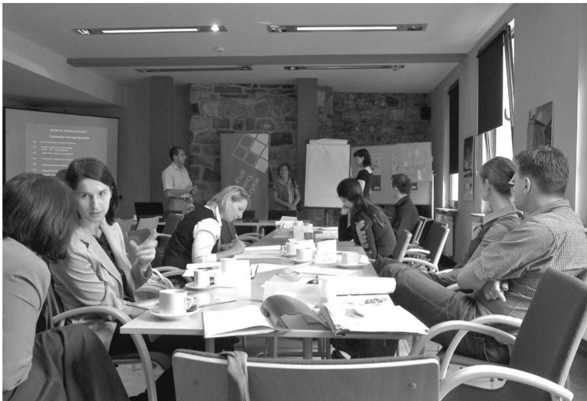
Warsztaty w cieszyńskim Zamku, fot. Kazimierz Branny

Technika ta świetnie sprawdza się w relacjach interpersonalnych, dzięki czemu wpływa również na poprawę relacji ze współpracownikami.