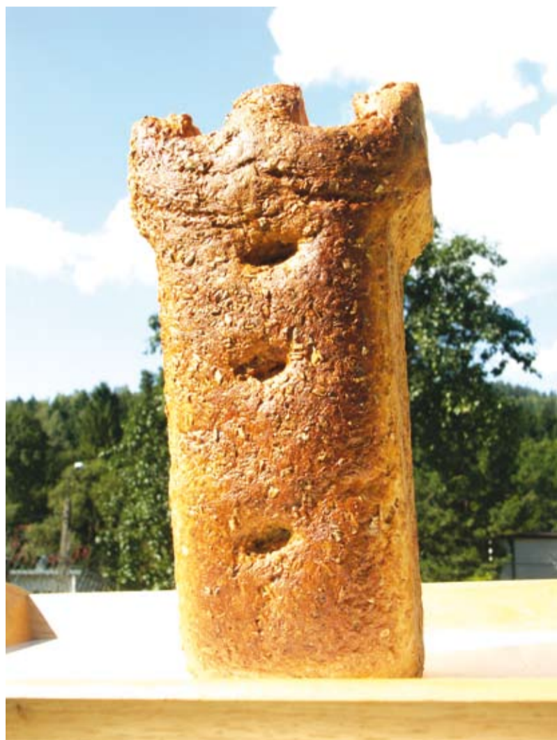
Jubileuszowy wypiek w kształcie Wieży Piastowskiej