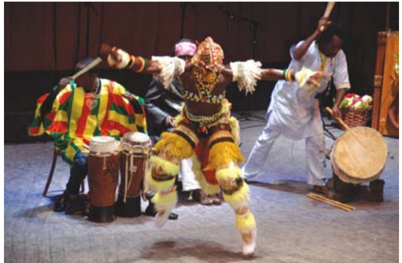
Na zdjęciach: Festiwalowi goście prezentują tańce z różnych regionów świata