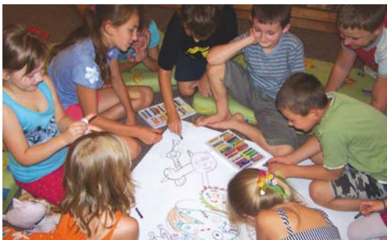
Wakacyjne warsztaty w Bibliotece